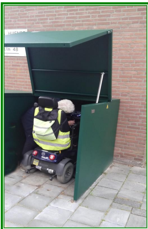
Bewoonster stalt haar scootmobiel in de nieuwe goed toegankelijke stalling.