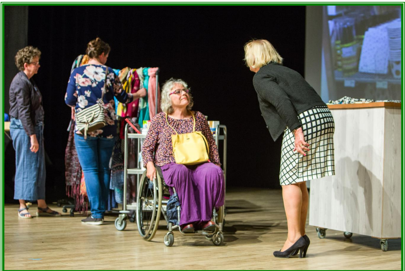
Acte uit het toneelstuk “Drempelvrees”.

Daar past alleen een groot applaus bij, maar vooral voor de leden van het gehandicaptenplatform en de spelers van de Narrekap. Bedankt dat wij mochten meegenieten!